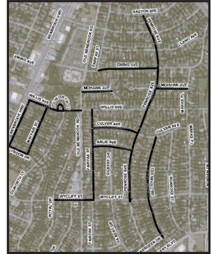
Council District 3, Project # 103382

Construction will impact customers in the Bomber Heights Area.