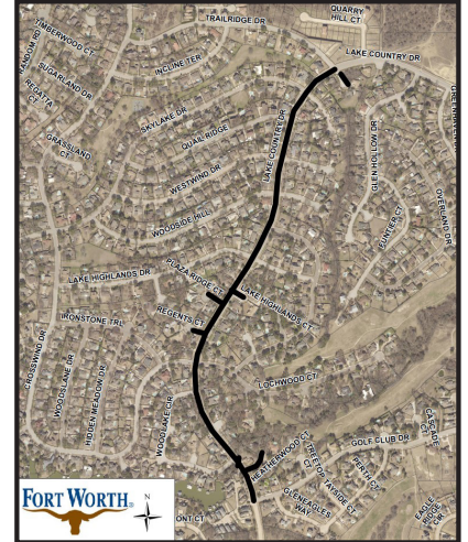
Distrito Municipal 7 Proyecto #103418

Las labores de construcción afectarán a usuarios de la asociación de propietarios Lake Country, Gleneagles y la alianza de la colonia Northwest Fort Worth.