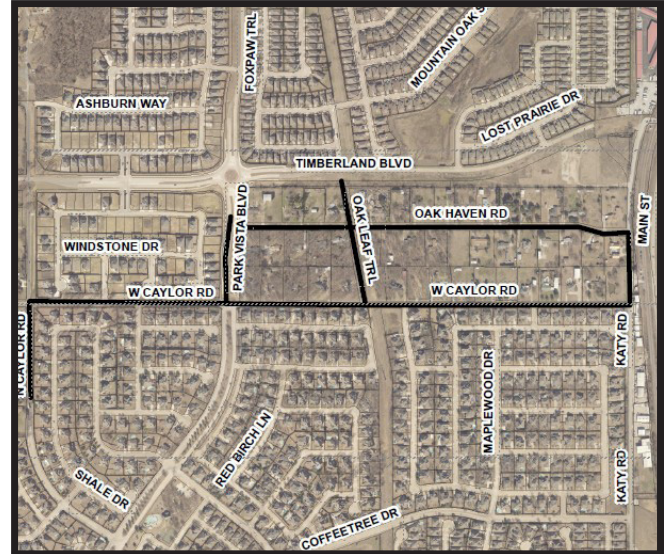
Council District 10 Project # 104020

Construction will impact customers in the Villages of Woodland Springs homeowners association, Steadman Farms homeowners association and the North Fort Worth Alliance.