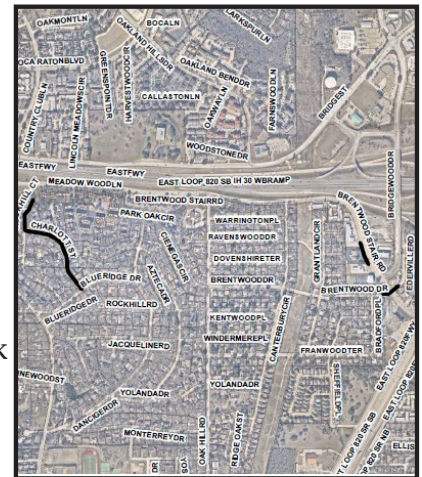
Distritos Municipales 11 y 5 Proyecto #103381-Part 2