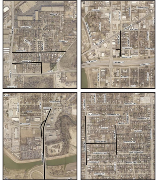
Distrito Municipal 11, Proyecto #103415

El proyecto se encuentra dentro del Distrito 11. La construcción afectará a los clientes en las áreas de Riverside, East Fort Worth y Oakhurst.