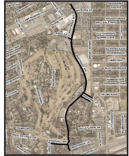
Council District 3, Project 103500

Construction may impact the Ridglea Area Neighborhood Alliance, Ridglea Hills neighborhood association, and Plum Valley Place HOA.